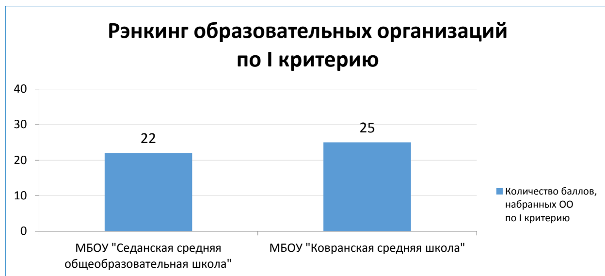
Диаграмма 1. Рэнкинг образовательных организаций по критерию «Открытость и доступность информации об образовательной организации»

Критерий оценки качества ОО, касающийся комфортности условий, в которых осуществляется образовательная деятельность рассматривался на основе показателей, описывающих материально-техническое и информационное обеспечение; условия для охраны, укрепления здоровья и организации питания; условия для индивидуальной работы с обучающимися, развития их творческих способностей и интересов; наличие дополнительных образовательных программ; возможности оказания психолого-педагогической помощи обучающимся; условия организации обучения и воспитания обучающихся с ограниченными возможностями.