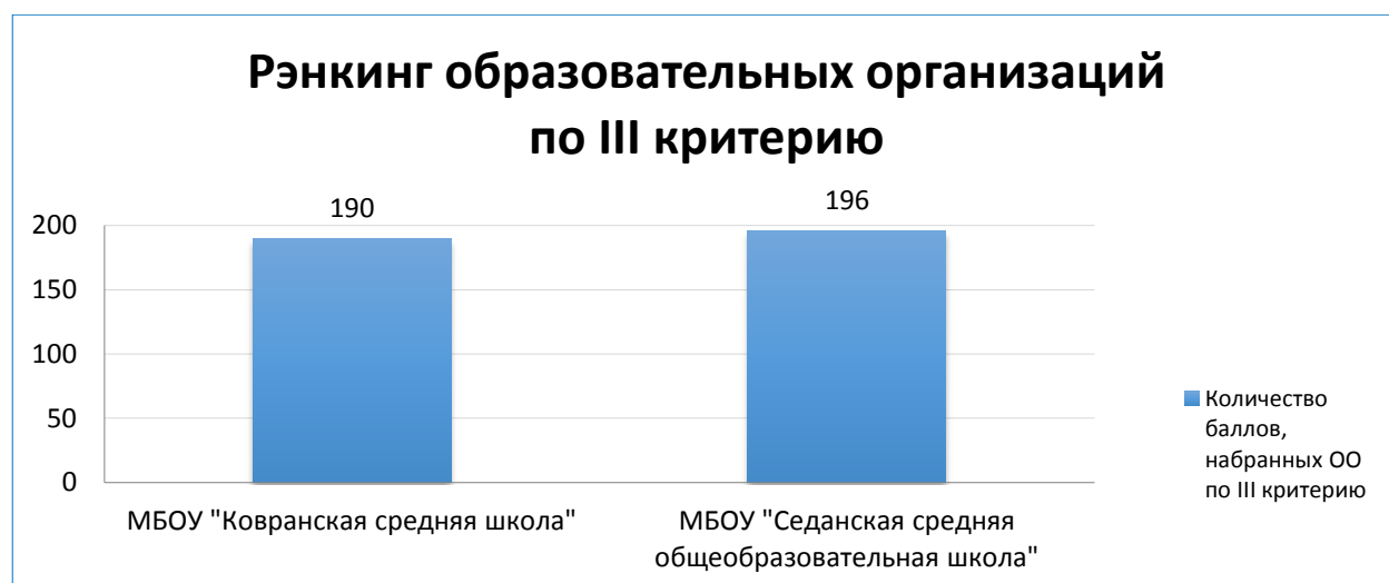
Диаграмма 3. Рэнкинг образовательных организаций по критерию «Доброжелательность, вежливость, компетентность работников».

У оцениваемых образовательных организаций достаточно высокими являются значения показателей по критерию «Удовлетворенность качеством образовательной деятельности организации». Однако не следует забывать, что пользователи образовательных услуг, оценивающие данные организации, могут не знать о существовании возможности реализации образовательной деятельности другими способами и на качественно более высоком уровне. Поэтому руководителям и сотрудникам оцениваемых образовательных организаций не следует останавливаться на достигнутых результатах.